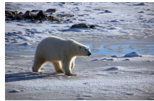
Groenlandia, scoperto "mondo" di ghiaccio sotterraneo - Clima - Ambiente&Energia