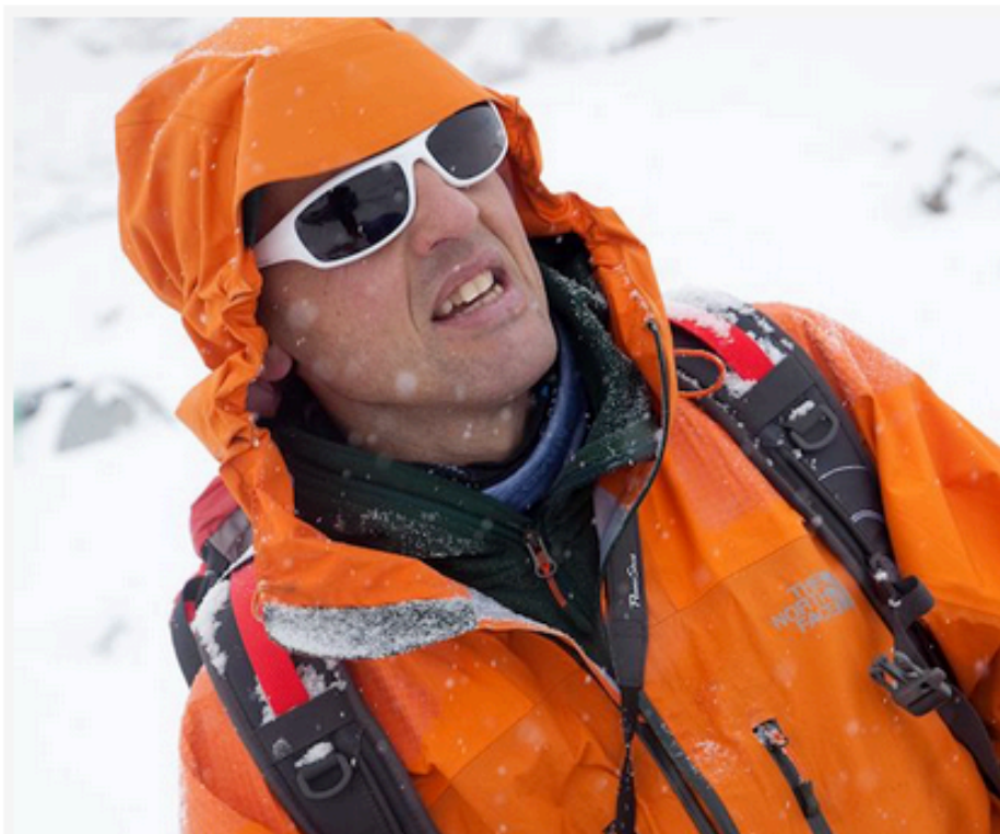
Simone Moro.

Arco e gli angoli più suggestivi del territorio del Garda Trentino saranno il palcoscenico di un ricco programma di appuntamenti.