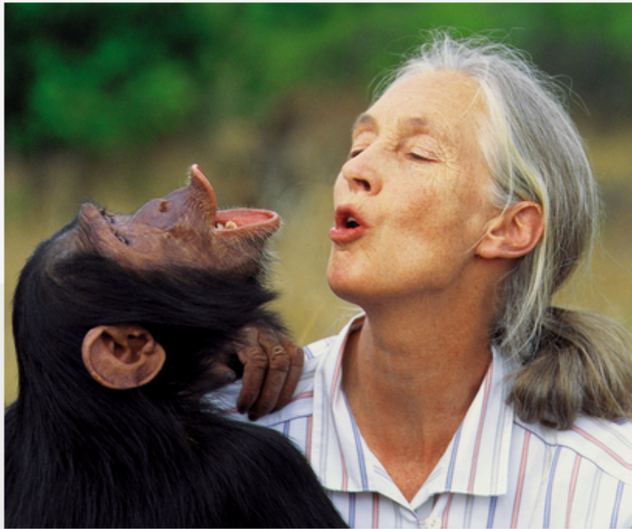
Jane Goodall.